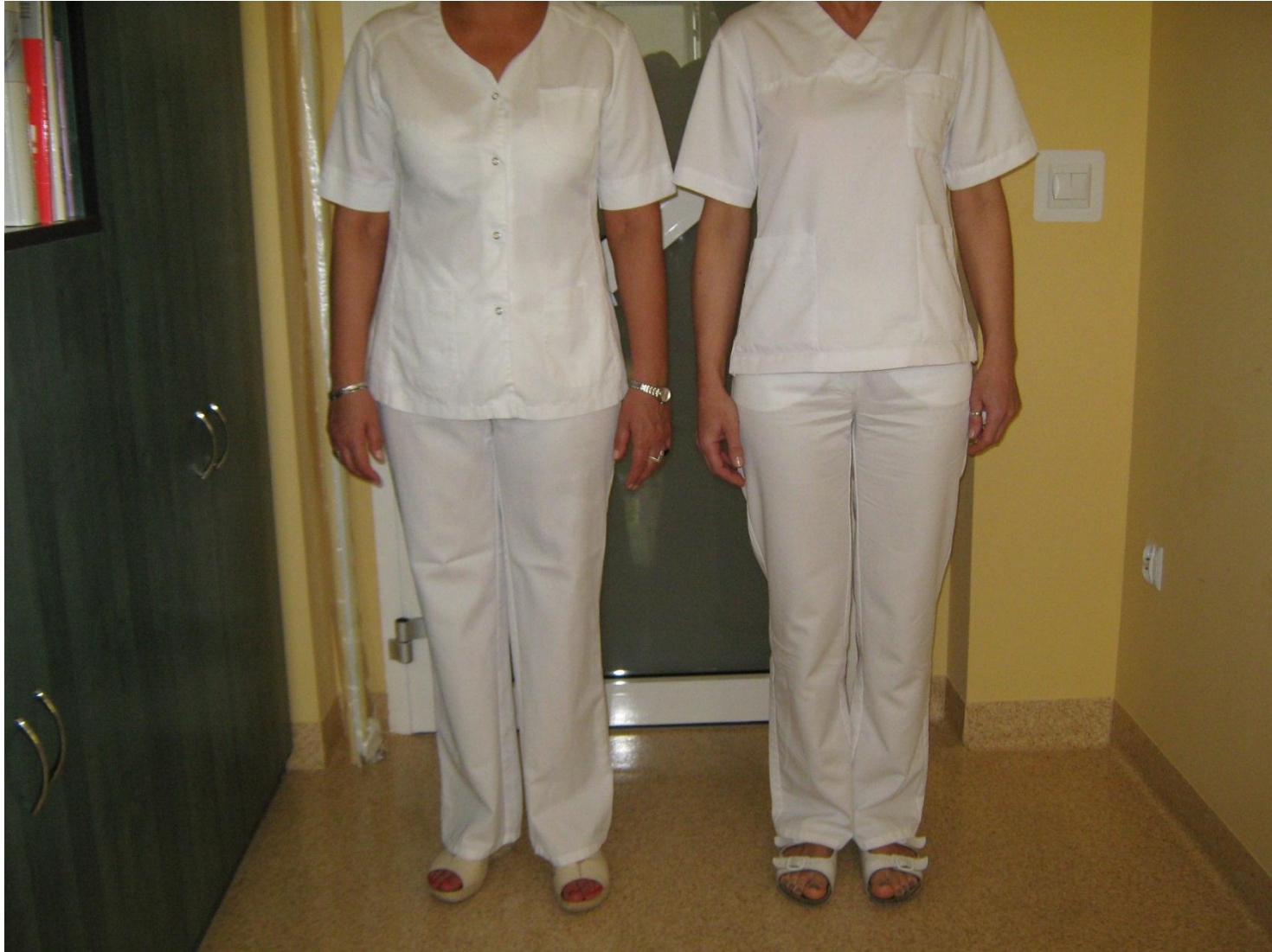
(Tested uniforms, cotton in the middle)

LCB-HEALTHCARE Procuring better building solutions